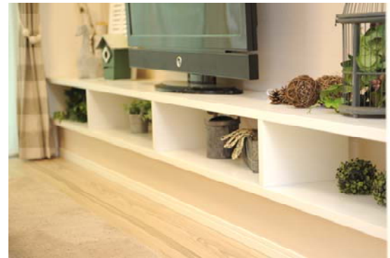
作り付けのTVカウンターはお洒落にディスプレイ。