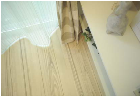
木目が際立つ美しいフロア。